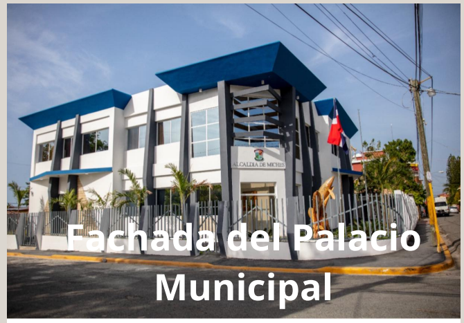
Fachada del Palacio Municipal