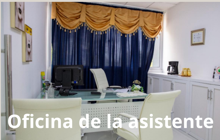
Oficina de la asistente