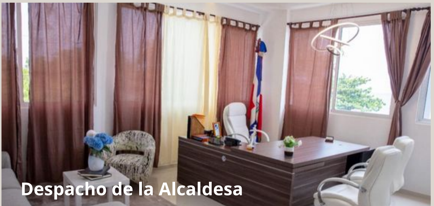
Despacho de la Alcaldesa