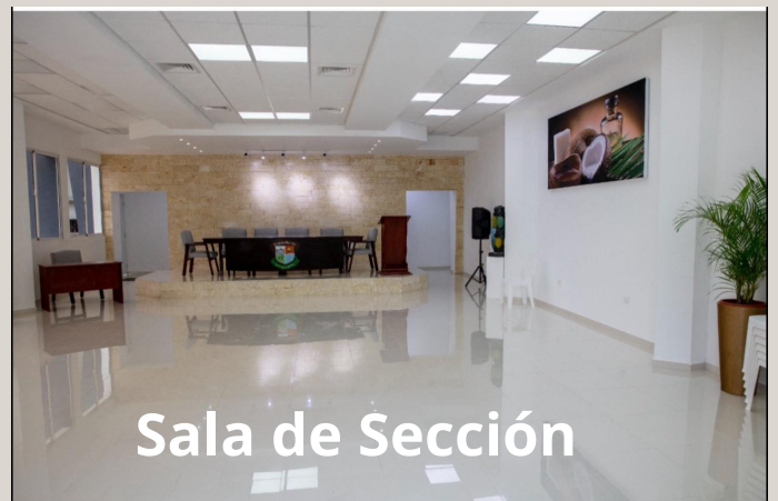
Sala de Sección