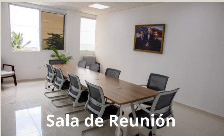
Sala de Reunión