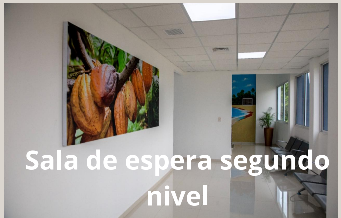
Sala de espera segundo nivel