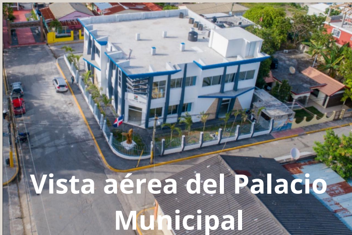
Vista aérea del Palacio Municipal