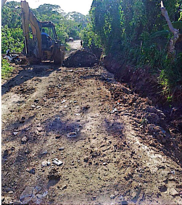
Limpieza y ampliado el camino detras de la escuela Los Mameyes