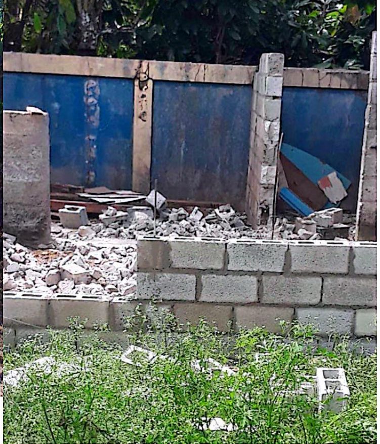
Trabajando con el mantenimiento de nuestro Matadero Municipal